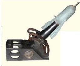
Mortier de 58 mm Crapouillot et sa torpille

Le 6 décembre 1914, le lieutenant Hans KILLIAN et ses hommes sont dans le village. Ils ont été formés au Fort d'ISTEIN (face à Kembs) pour se servir des «Minenwerfer». Cette arme est apparue dans l'armée japonaise en 1904 lors du conflit avec les Russes. L'armée allemande a déjà réalisé ces prototypes en 1913. C'est l'un des essais face à l'ennemi. Les Poilus voient s'élever les projectiles à quelques centaines de mètres d'eux, tirés à une cadence jusqu'à 15 coups-minute, puis plonger verticalement dans la tranchée et exploser à l'impact. L'Etat Major est sidéré. Il fait venir des forts Belfortains les antiques mortiers datant du siège de 1870 comme vaine riposte. Il faudra attendre le printemps 1915, après de multiple bricolages, pour la mise au point du premier véritable mortier Français. Sa forme de crapaud lui voudra le nom de « Crapouillot » .