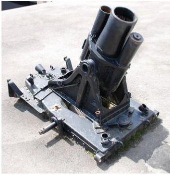
Minenwerfer existe en calibre 75 -170 -250 mm