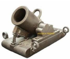
Mortier de siège 1838 équipant la citadelle de Belfort